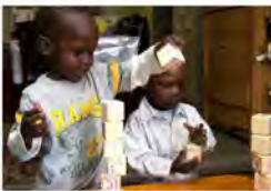
Tyler: Completa la actividad a pesar de las frustraciones